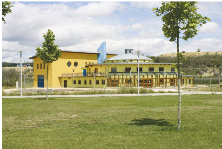
Edificio CIRCE/Campus Río Ebro